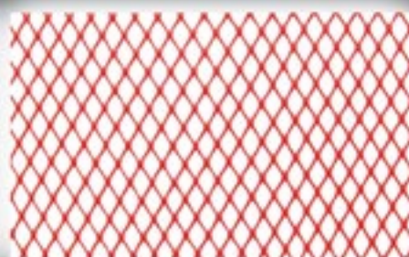
Malla 2 Hilos