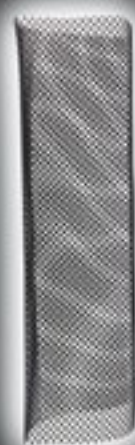
Protector Negro Tubo