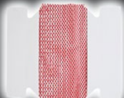
Cubre Genérico 2'5 Kg.