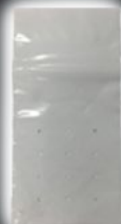
Protector Negro Plano