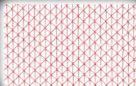
Malla 3 Hilos